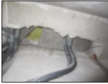
Photo N° 1287 AMIANTE CIMENT - placards elec rdc à +5 Plafonds Plaques planes (Fibres-ciment)